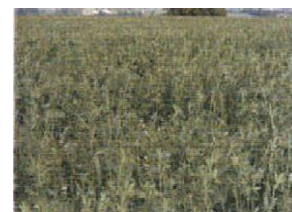
Prairie multi espèce avec luzerne et trèfle blanc