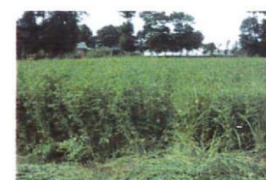
Luzerne + dactyle en 3 e coupe