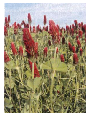
Trèfle incarnat semé avec une association RGH + trèfle violet