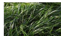
Ray Grass Anglais