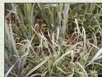
Dactyle et trèfle blanc semés avec un couvert d'avoine